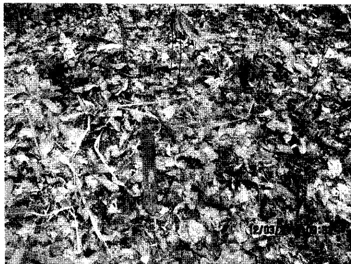
Fotografía No. 1 Sitio a perforar

La empresa CCX COLOMBIA S.A, requiere realizar una perforación exploratoria de 90 metros de profundidad, de acuerdo a los resultados obtenidos por los estudios geoeléctricos aportados, con el objeto de contar con un pozo de agua para el uso doméstico y monitoreo. Por ello se realizó la visita de inspección visual al nuevo sitio seleccionado para la perforación con el objeto de determinar las condiciones ambientales de este.