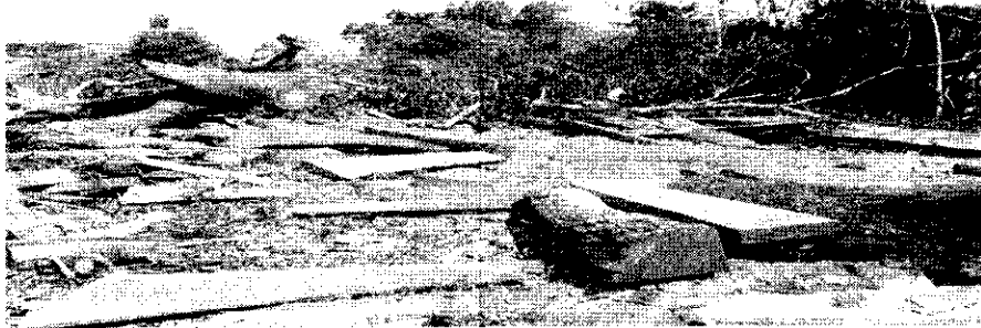
Tala de otro árbol de Caracoli a orilla del rio(sector los Parujanos)