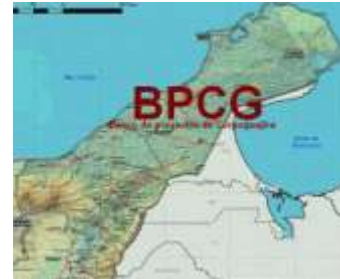
Banco de Proyectos de Corpoguajira