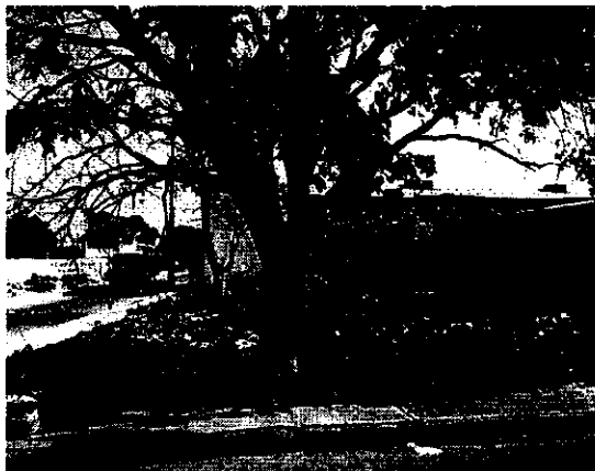
Árbol de Mamon ubicado dentro del andén