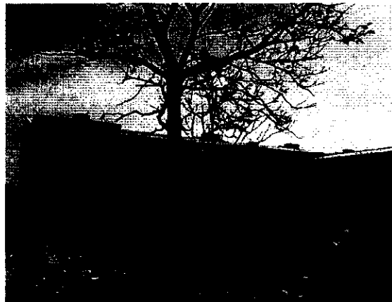
Árbol de roble ubicado dentro del área a edificar