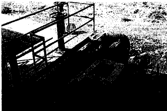
Imagen 3. Entrada del agua a la planta