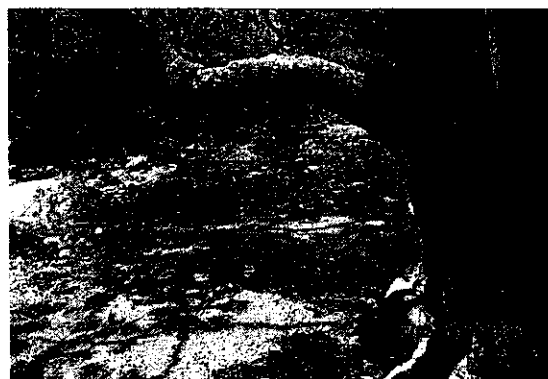
Imagen 4. Panorámica del río abajo de la bocatoma I