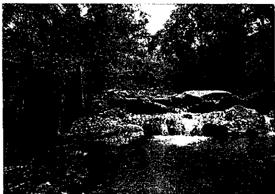
Imagen 1. Estado de la bocatoma II