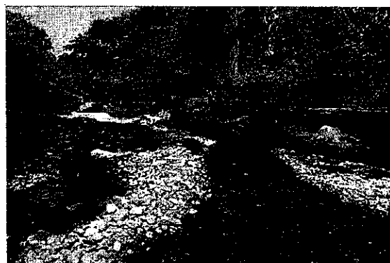
Imagen 2. Estado del río arriba de la bocatoma II