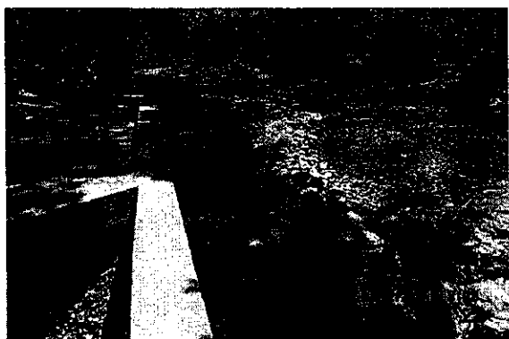
Imagen 3. Estado de la Bocatoma I