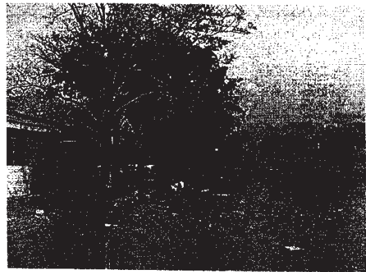
Se Observan los árboles en el lote adquiridos por Almacenes Exitos en pie