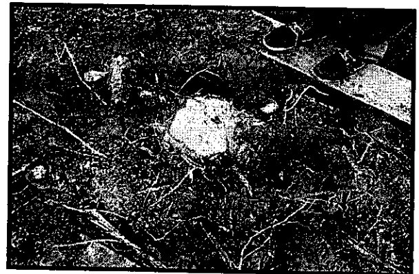
Tocones de árboles cortados en el boulevard de la calle 14 avenida de Villanueva tomados como evidencias