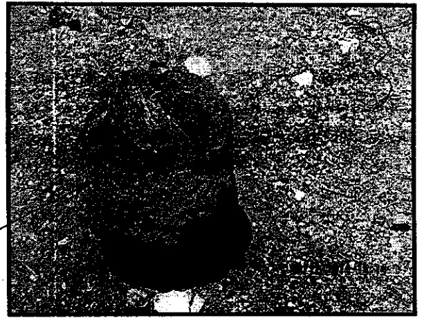
Fotografía No 2