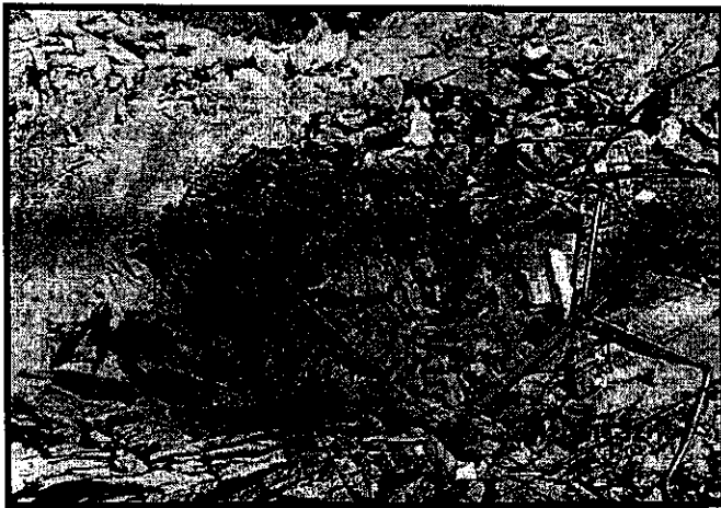
Fotografía No 1 Tocón con comején