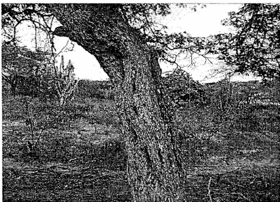
Especie Dividivi ( Lividivia coriaria )