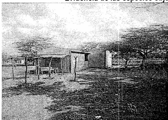
Colegio del caserío los cerritos