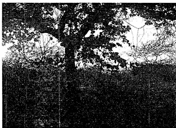
Especie Guamacho ( Pereskia guamacho )