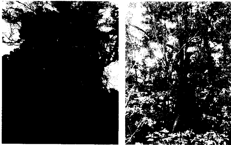
Imagen 2: se aprecia el árbol de Mamón ubicado a pocos centímetros del árbol de Trupillo. Se observa parte de su altura y cobertura las cuales representan el mismo riesgo que el árbol mencionado anteriormente.