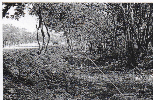
Margen izquierda de la vía cuestecita – predio “La Cabellona”, Albania - La Guajira.