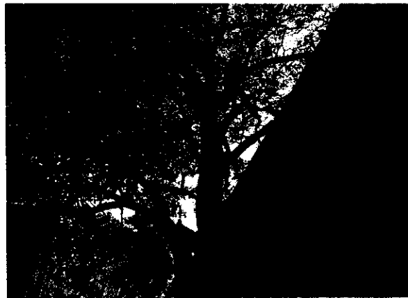
Copar de árbol de Roble sobre pasando el tejado

Las fotografías, demuestran que si se ordena una poda, habría que realizarla por debajo de la infraestructura, quedando el árbol descompensado en biomasa foliar, lo que debilitaría la capacidad de rebrote y posteriormente se presentaría la muerte descendente del árbol, estas y otras razones de ubicación, en estos espacio colonizados arquitectónicamente y basado en el artículo 57 del decreto 1791, nos dan la facultad de conceptuar que lo más conveniente, sería ordenar la tala de la especie en ese lugar no sin antes solicitar la siembra de otro individuo en su reemplazo.