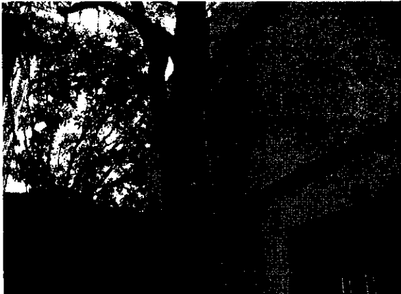
Arbol de Roble pegado a la infraestructura