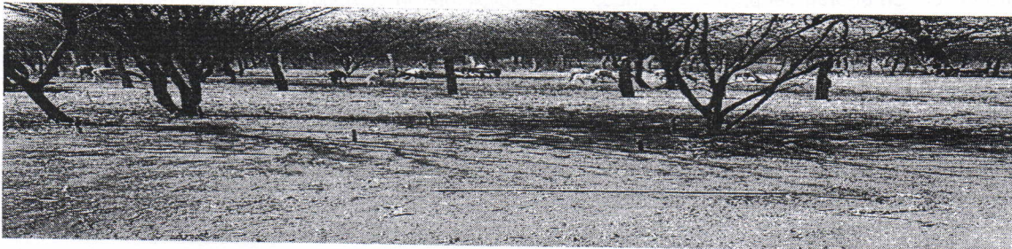
Fotografía No. 1 Sitio a perforar predio Comunidad JURIAKATH