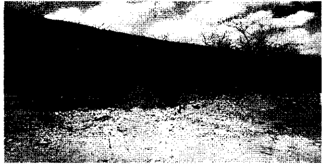
EVIDENCIA DE LA VEGETACIÓN PRESENTE EN EL ÁREA PERMISIONADA