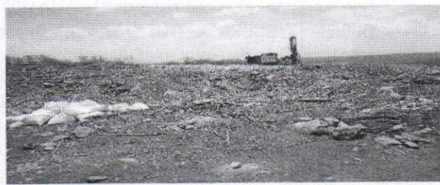
EVIDENCIA DEL ÁREA DESCAPOTADA, PARA LA EXTRACCIÓN DE MATERIAL DE CONSTRUCCIÓN