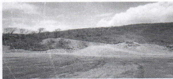
VISTA PRINCIPAL DE LA CANTERA MAJO, INCLUYE VÍAS DE ACCESO