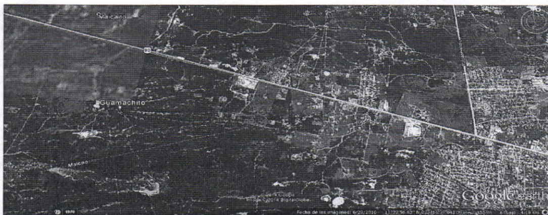
Imagen No. 1 Localización predio Comunidad LA PAZ

El predio se ubica en zona rural del municipio de Maicao, se tiene acceso al predio tomando la vía Riohacha – Uribía, en las coordenadas mostradas en la tabla No.1. Con el objeto de conocer las características hidrogeológicas del subsuelo, en el área se ejecutaron tres (3) sondeos eléctricos verticales, para la interpretación de los datos de campo fue utilizado el programa denominado Ipi2Win. De acuerdo a los resultados obtenidos en el sitio de realización del SEV1 se presentan las características más favorables para emprender una perforación exploratoria en busca de agua subterránea de baja mineralización.