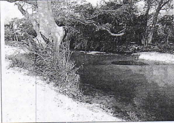
Árbol de higuierón en pie y ubicado en área protectora de la margen izquierda del río caña, es decir en predios de los Correa