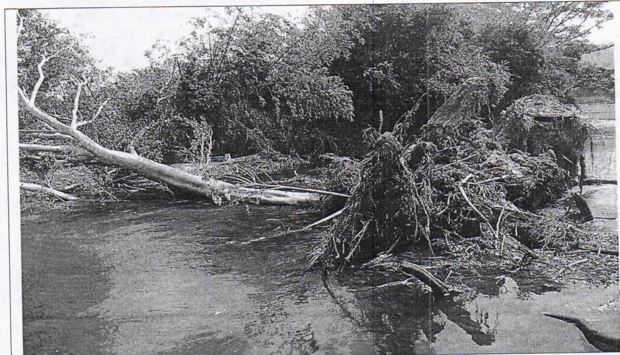
Árbol de higuierón caído y atravesado en el cauce del río caña, estaba ubicado en la margen izquierda es decir en predio de los Correa.