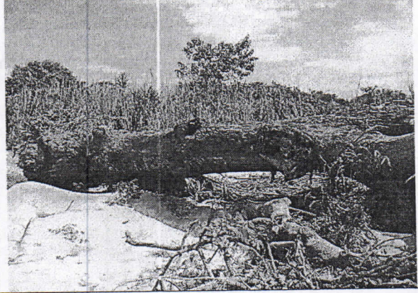
Árbol de Caracolí caído, ubicado en la margen izquierda del río caña y en predio de los Correas