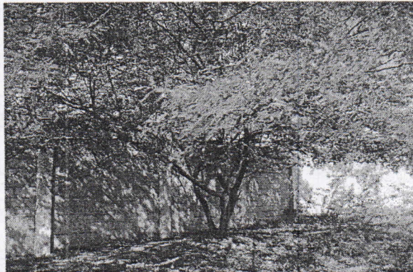
Árbol de Aromo ( Acacia aroma ), "Espinito", ubicado dentro del lote