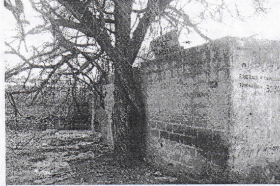
Árbol de trupillo ( Prosopis juliflora ), adulto dentro del lote