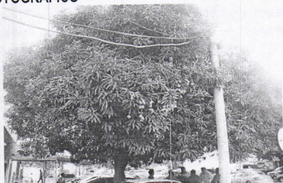
Árbol de Mango que interfiere con las redes eléctricas