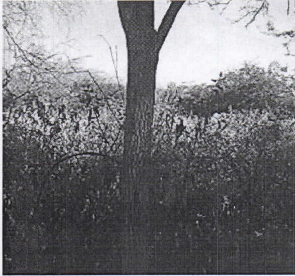
Dividivi ( Lividivia coriaria )