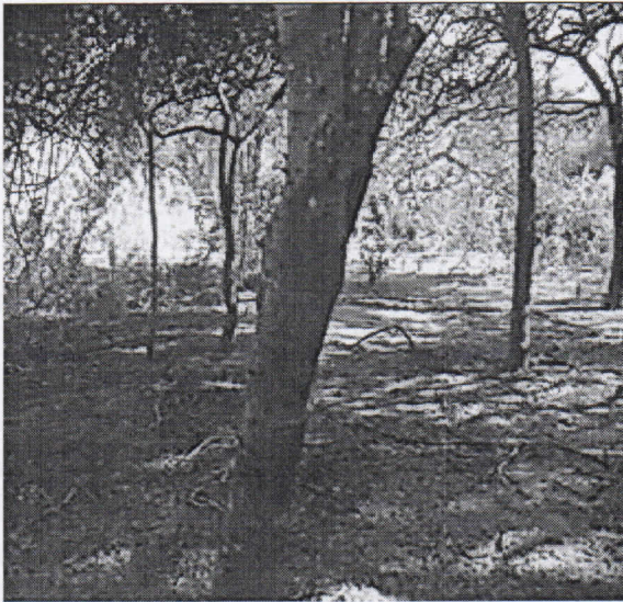
Guamacho ( Pereskia guamacho )