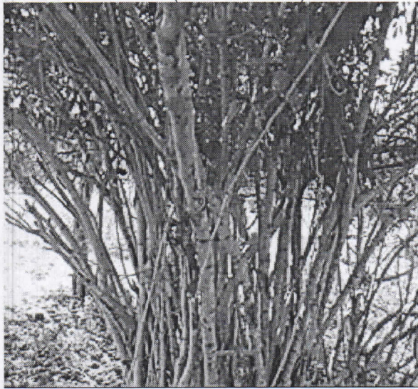
Pastelillo ( Coccoloba sp )