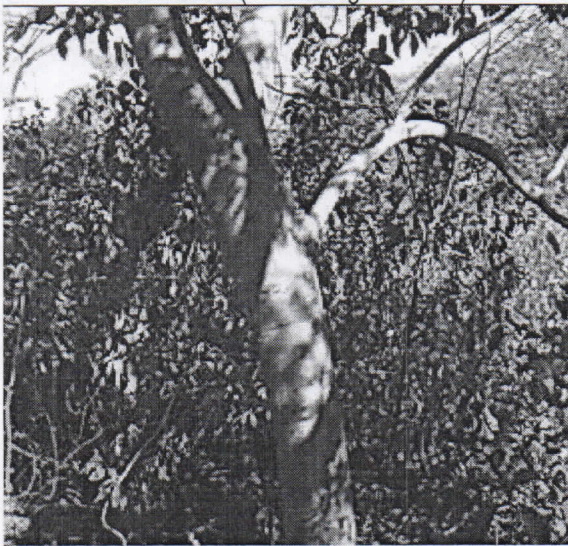
Toco blanco ( Crataeva tapia )