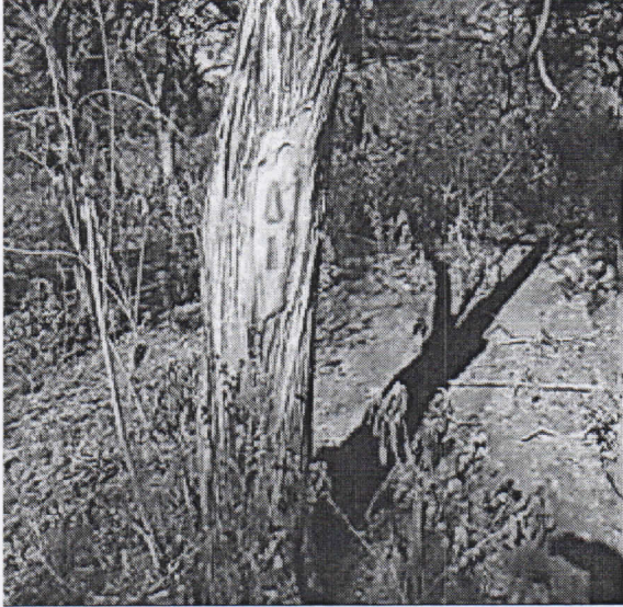
árbol de Trupillo ( Prosopis juliflora )