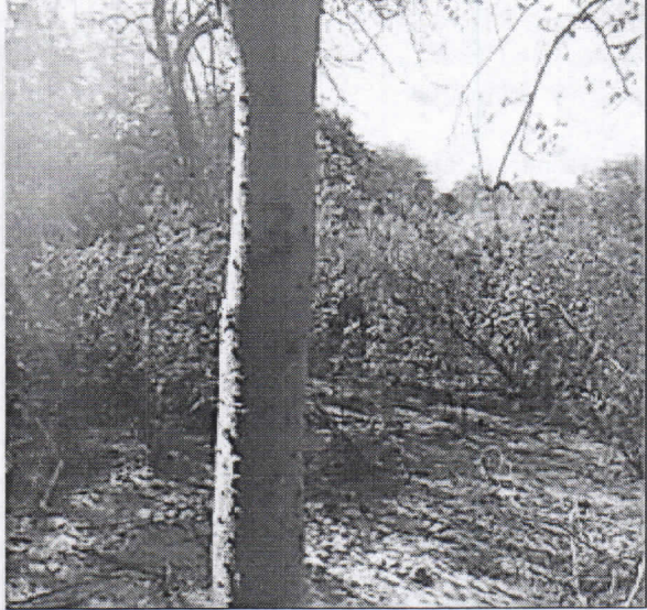
árbol de Guamacho ( Pereskia guamacho )