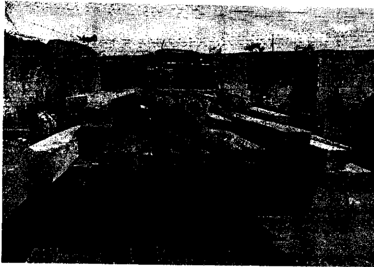
Vehículo con madera de Cañaguatè y Algarrobbillo ubicado en el parqueadero del trànsito del Municipio de Maicao