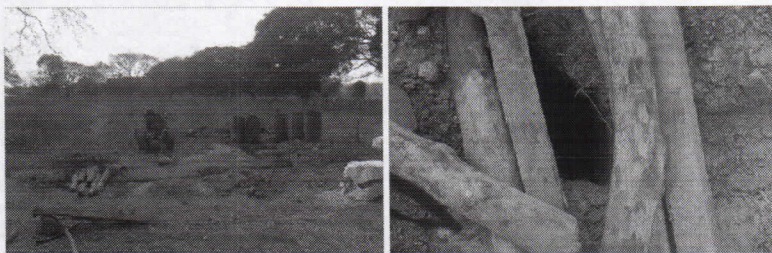
ELEMENTOS QUE SE UTILIZAN EN LA PERFORACION EXPLORATORIA