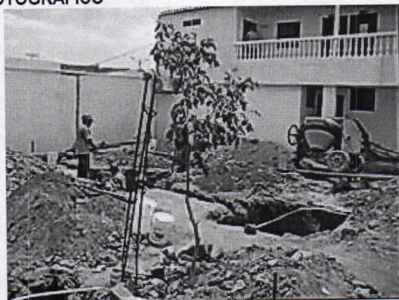
Árbol joven de Mamón ( Melicocca bijuga )