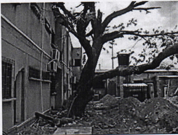
Árbol de Campano ( Samanea guachapele )