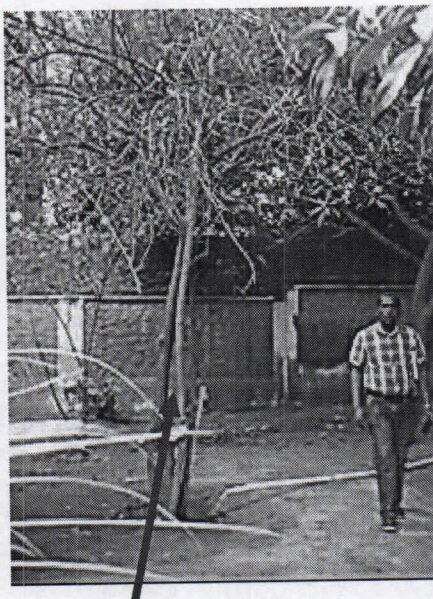
Árbol de Naranja seco y muerto