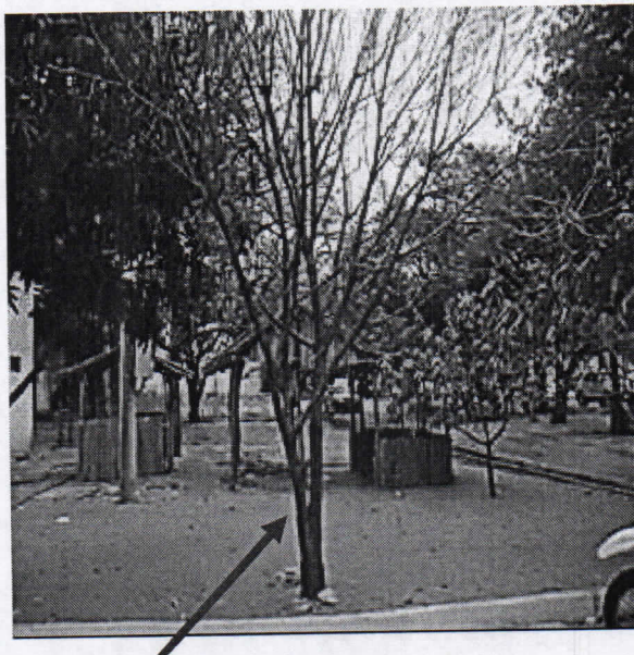
Árbol de Mango muerto y seco