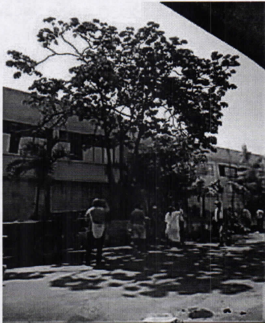
Árbol de Guarumo ( Cecropia peltata L.)