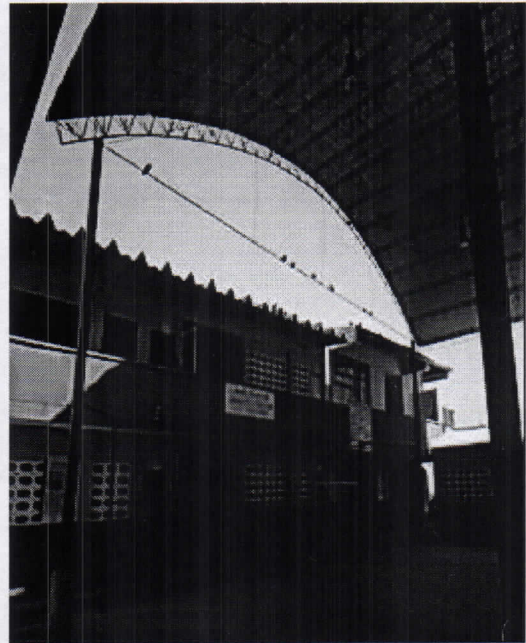
Palomas residentes del plantel educativo

Evidencias de árboles de Ninn solicitados para podas en la Institución Educativa san José de Maicao