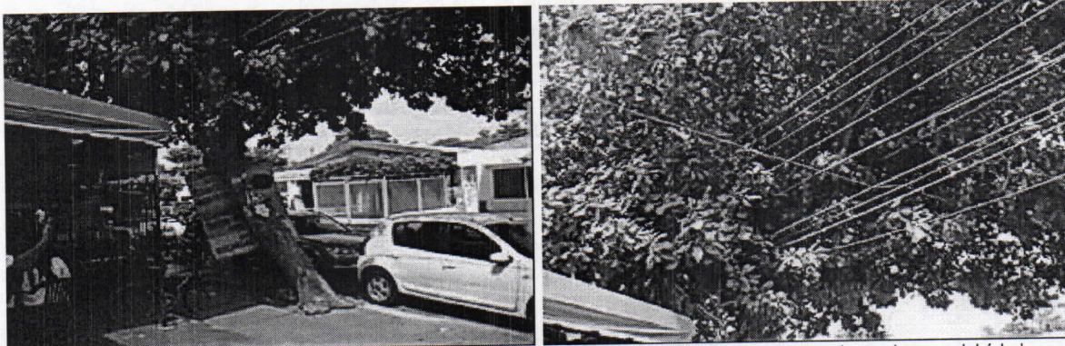
Izquierda, Inclinación del árbol de almendro. Derecha, redes eléctricas de baja tensión entre cruzadas en la copa del árbol.