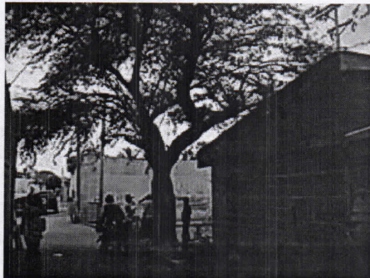
Izquierda. Líneas eléctricas de baja tensión entrecruzadas en la copa del árbol de Trupillo. Derecha imagen de la parte lateral del inmueble y ubicación del árbol de Trupillo.