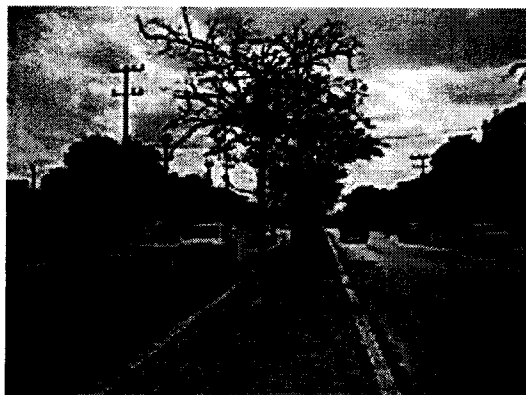
Izquierda, Matarratón ( Gliricidia sepium ), para poda en el andén de la calzada sur. Derecha, Almendra ( Terminalia catappa ) en el bulevar de la calle 15 de la ciudad de Riohacha.