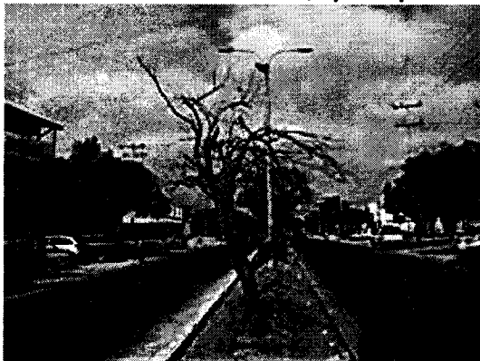
Izquierda, Corazonfino ( Platymiscium pinnatum ) seco. Derecha, Mamón ( Melicocca bijuga ), seco; ambos en el bulevar de la calle 15 de la ciudad de Riohacha.