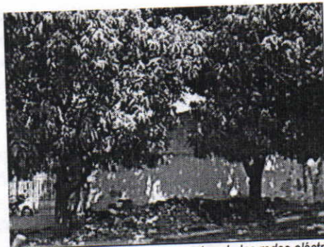
Ubicación de los dos (2) árboles de mangos en la propiedad de la señora Lilibeth Contreras Peralta mostrando las redes eléctricas entrecruzadas en la copa de los árboles y la conformación general de los mismos.