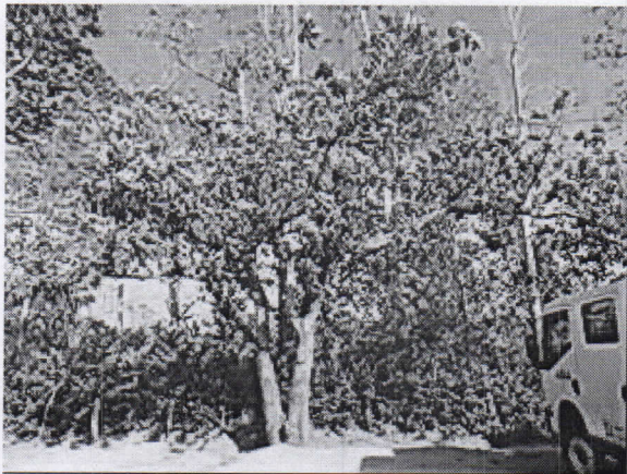
Caracolí ( Anacardium excelsum )