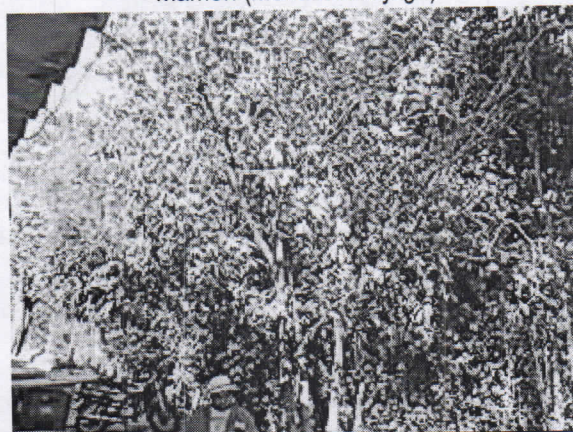
Nispero ( Manilkara zapota )