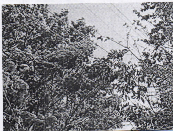
Algarrobillo ( Samanea saman )