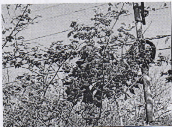
Mulato ( Acacia riparia )