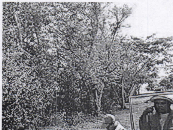
Guácimo ( Guazuma ulmifolia )