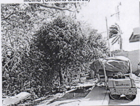
Mango ( Mangifera indica )