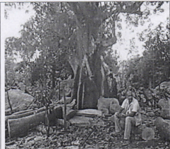
Imagen completa del árbol