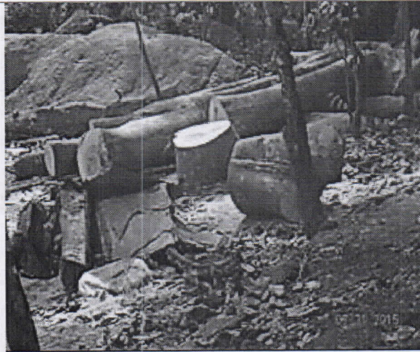
Productos repicados de las ramas caídas