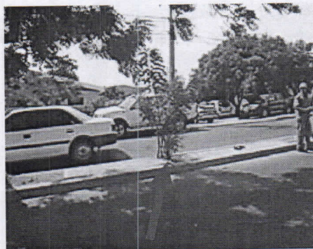
Sitio por donde pasará la zanja y árboles de Neem que requieren ser talados