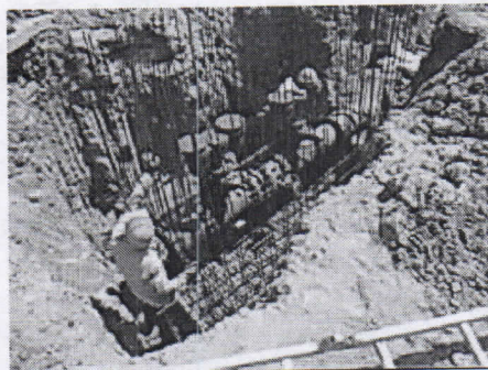
Obras avanzando hacia el sitio donde se ubican los árboles de Neem en la carrera 15 con calle 16