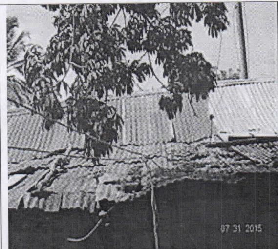
Ramas del árbol de ceiba por encima del tejado