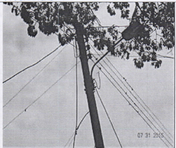
Ramas haciendo interferencia con las redes eléctricas