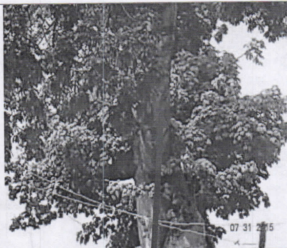
Rama que consideramos cortar