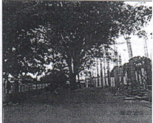
Árbol de Ficus