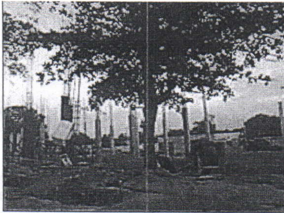
Árbol de Almendra