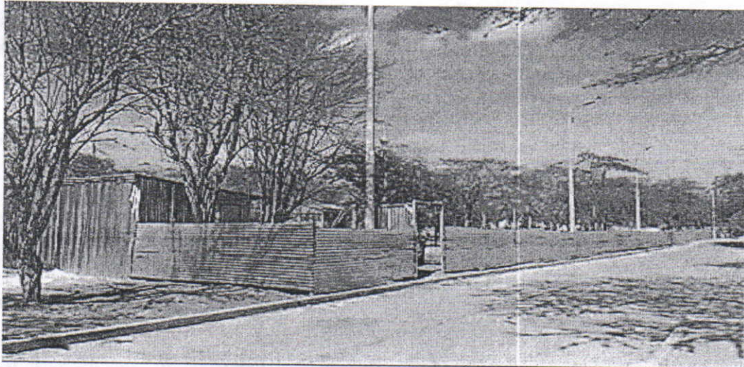
Área encerrada donde la Universidad de la Guajira proyecta la construcción del bloque para la educación Tecnológica (1420m 2 ).