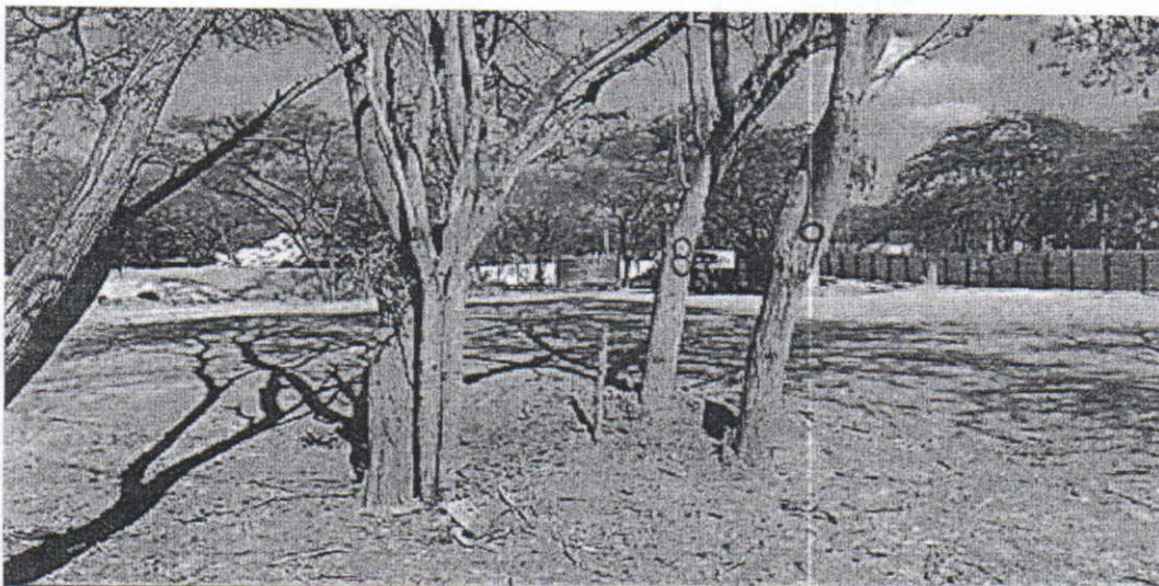
Evidencia de la especie Trupillo ( Prosopis juliflora ) dentro del área donde la universidad de La Guajira proyecta la construcción del bloque para la educación tecnológica.

Ubicación satelital del sitio donde la Universidad de La Guajira, requiere intervenir dos especies mediante tala por la construcción del bloque modular tecnológico.