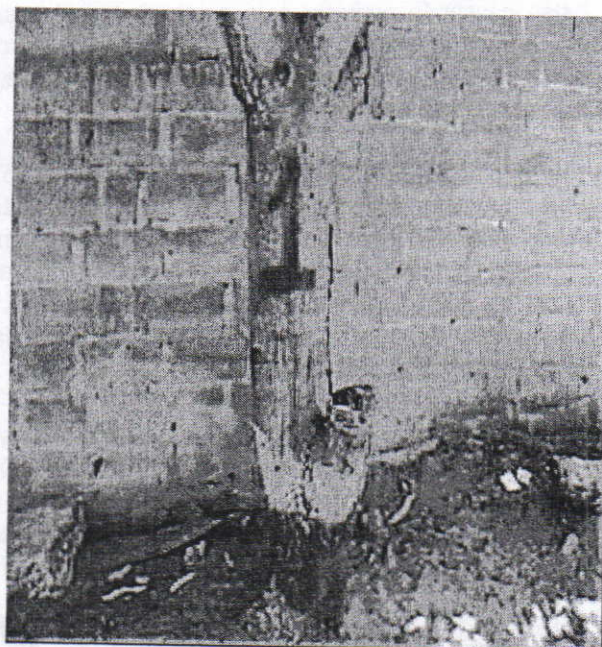
Mango ( Mangifera indica ), Marcado con el No. 1