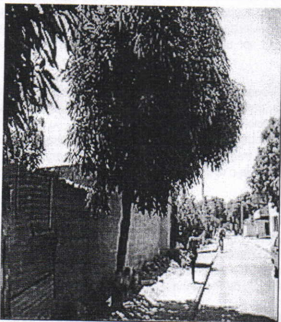
Mango ( Mangifera indica ) carrera 14 con calle 16 A