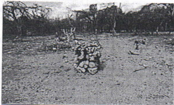
Un Burro de leña