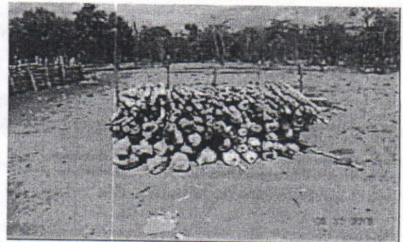
Cuatro burros de leña