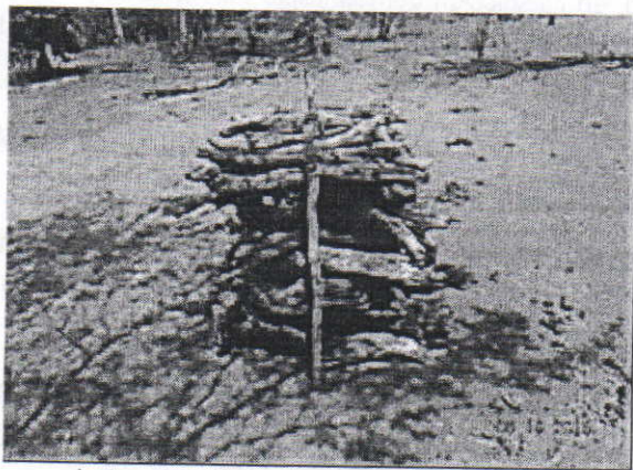
Leña recogida en la ranchería Mashitshi