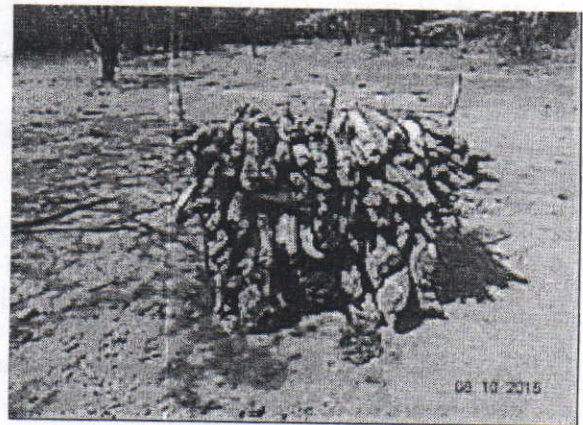
Dos Burros de leña seca