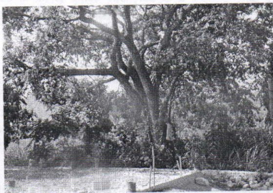
Vista de los árboles a intervenir