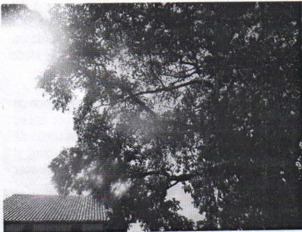
Vista de la copa aérea del árbol