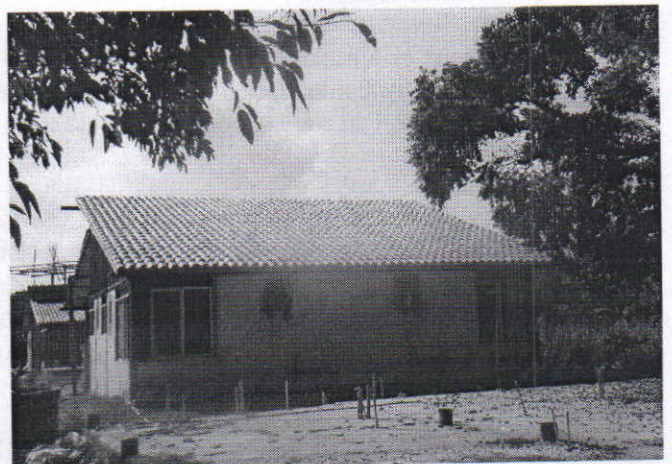
Vista de la vivienda y la ubicación de los árboles