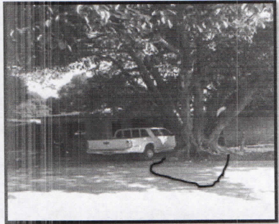
Fig. 3 En la imagen se observa que el árbol efectivamente causa un peligro eminente al hogar del sr JOSÉ JULIÁN GÓMEZ pues las ramificaciones del árbol se encuentran por encima del tejado de la vivienda.

Fig.4 Se observa que el árbol presenta buen estado pero sus raíces le están causando daño a la estructura vial de la calle 14.como a las estructuras de la vivienda anteriormente mencionada y a las redes de alcantarillado de las casas circunvecinas.