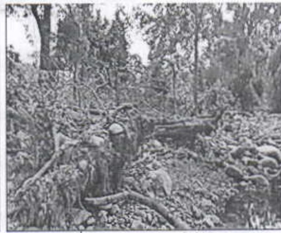
Árboles de Guama Caídos