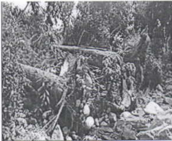
Árboles de Perehuétano y Caracoli caídos