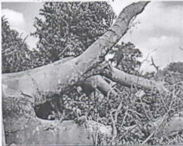
Árbol de Orejero Caído