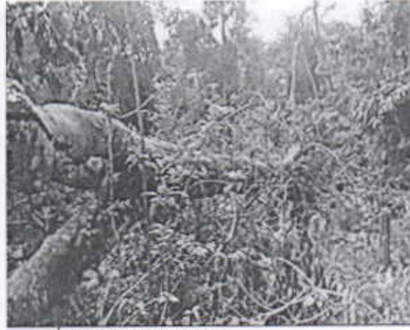
Árbol de Guama caído