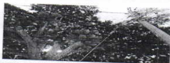
INTERFERENCIA DE LAS LÍNEAS CON LA COPA DEL ÁRBOL