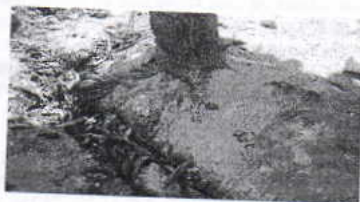
ESTADO DE LA RAZA DEL ARBOL