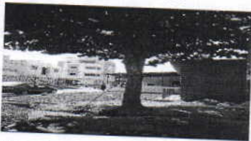
VISTA DEL ÁRBOL A INTERVENIR