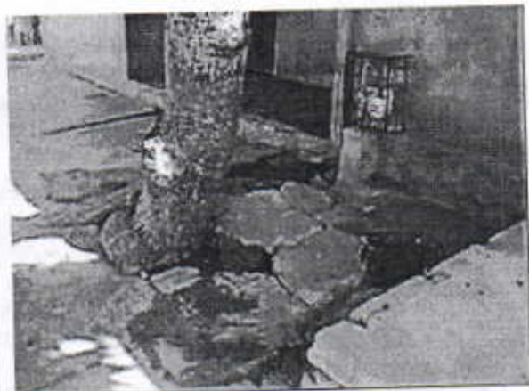
Deterioro del piso del andén