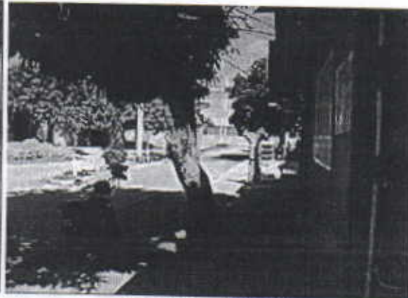
vista general del árbol