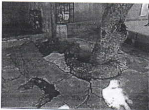
Cuello de ganso formado al pie del árbol