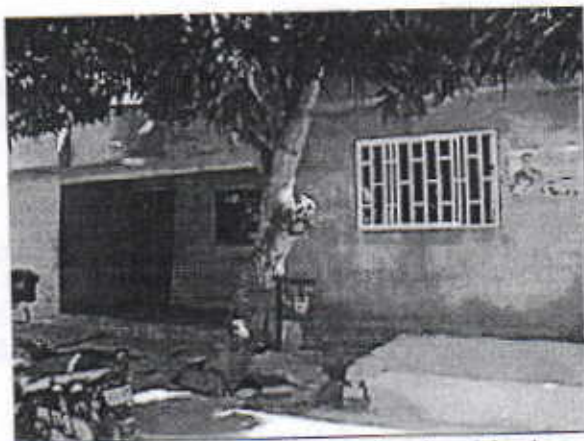
Árbol de mango frente a las dos viviendas