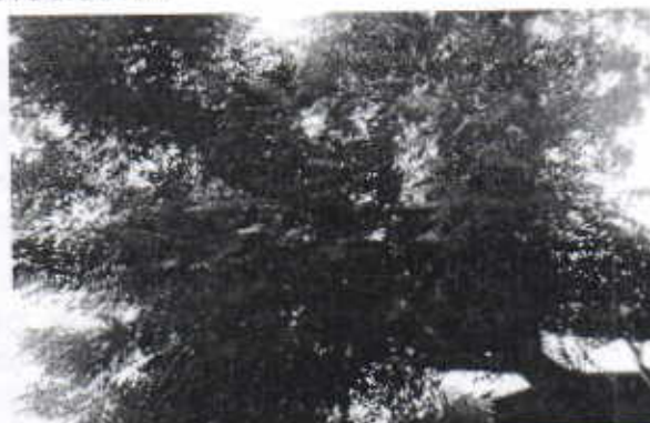
Vista de los Árboles a Intervenir de la especie Azadirachta indica (Nin) a intervenir