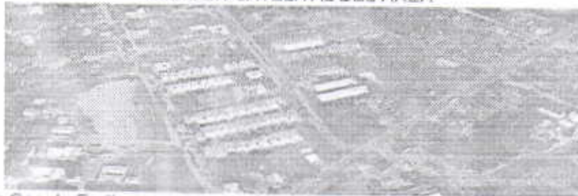
IMAGEN SATELITAL DEL ÁREA