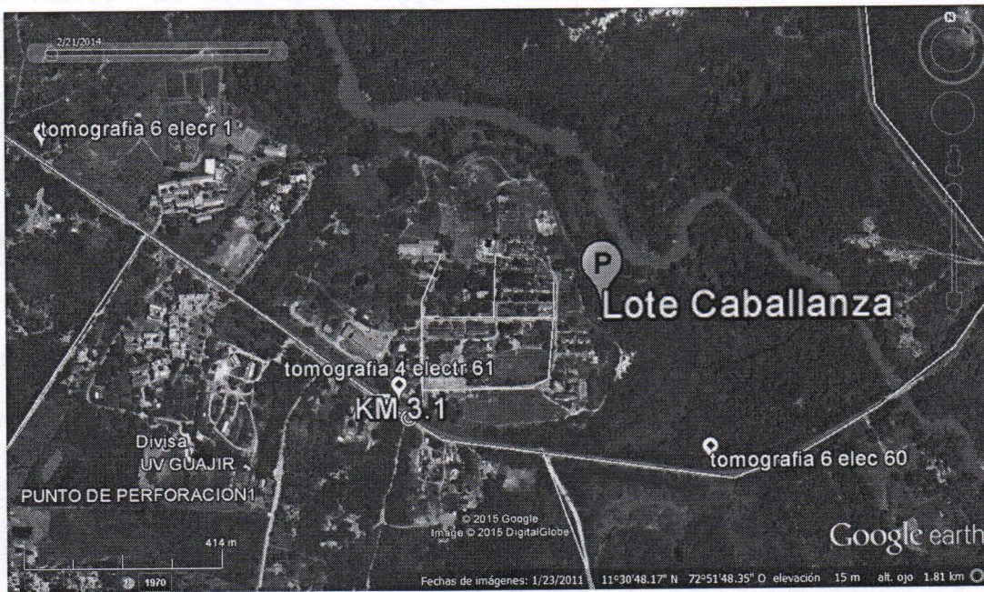
Figura No.1 Localización LOTE CABALLANZA

Para la determinación de la zona acuífera de interés se tuvieron en cuenta los resultados de las tomografías 3, 4 y 6y específicamente los obtenidos en el registro topográfico número 6, el cual mostró en algunos puntos condiciones favorables para la explotación de fuentes subterráneas, para cual se recomienda realizar una perforación de prueba de 400 metros de profundidad en el electrodo número 31, ubicado a 820 metros del último electrodo, denominado perforación propuesta número 6.