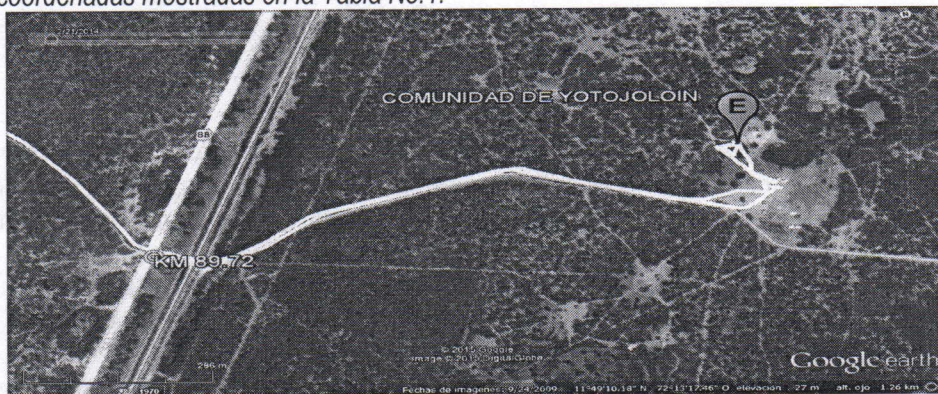
Figura No.1 Localización del Predio

El punto de perforación escogido se encuentra ubicado, en jurisdicción del municipio de Uribia departamento de La Guajira, en predios de la comunidad indígena de Yotojolin. Se llega al sitio por la vía que conduce de la ciudad de Uribia a puerto bolívar, Cruzando a mano derecha en el kilómetro 89.72 (ver figura 1), a partir de ahí se recorren 1.13 kilómetros hacia dentro, en las coordenadas mostradas en la Tabla No.1.