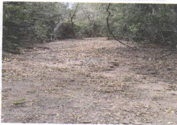
Fotografía 4: Arroyo la Ceiba K4+606 –Cauce Efímero definido