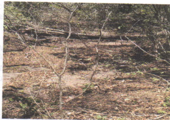
Fotografía 2: Afluentes del Arroyo Caurina – Otros surcos y Cauces aledaños interceptores del eje de la vía.