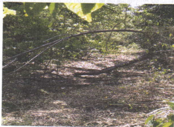
Fotografía 5: Arroyo el Cequión K2+920 – Eje de la Vía