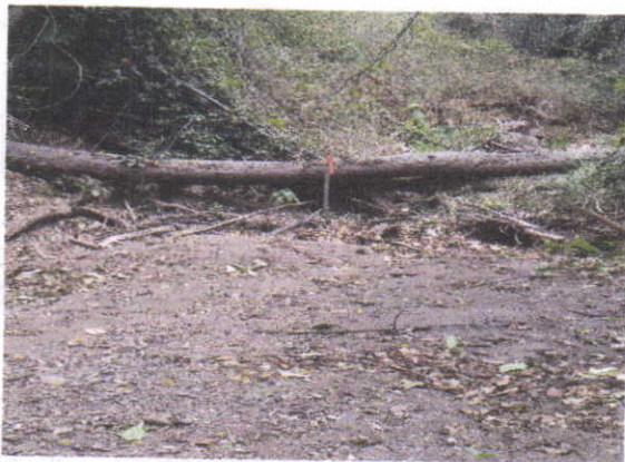
Fotografía 3: Arroyo la Ceiba K4+606 – Eje de la Vía