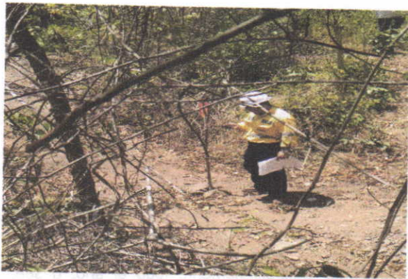
Fotografía 1: Arroyo Caurina K8+650 – Eje de la Vía