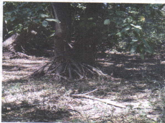
Fotografía 6: Arroyo el Cequión K2+920 –Tipificación de Zona de planicie de Inundación