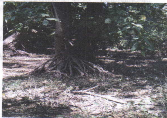
Fotografía 1: Arroyo el Cequión K2+920 – Eje de la Vía