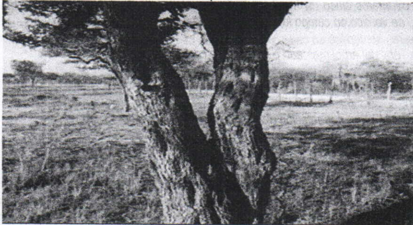
Arbol de Dividivi ( Libidivia coriaria )