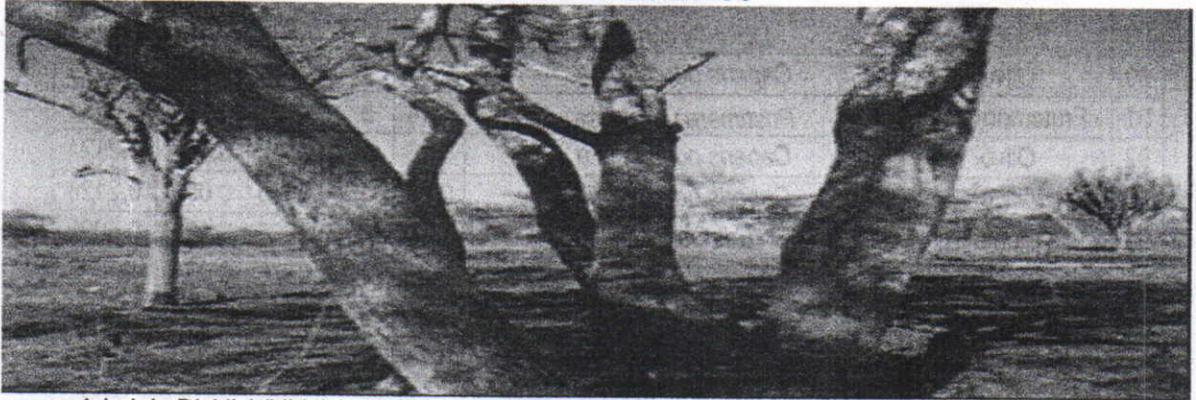
Arbol de Dividivi ( Libidivia coriaria ) verificado en campo le corresponde los Números 33, 34 y 35