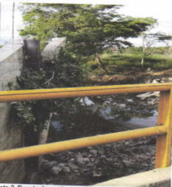
Foto 2. Puente derrumbado, material sobre el cauce.