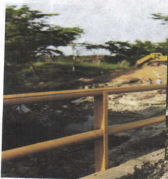
Foto 3. Maquinaria tratando de despejar el cauce.