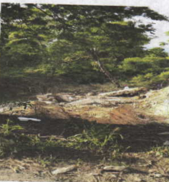
Foto 4. Material del antiguo puente sobre la Quebrada Moreno

La estructura desplomada viene ocupando el cauce de la corriente de la Quebrada Moreno, obstaculizando el recorrido normal de las aguas y generando pequeños represamientos temporales, que pueden ser mayores en la medida que la cantidad de agua que por allí pasa pueda aumentar súbitamente. Es necesario señalar que según habitantes del sector, la maquinaria del contratista ha venido ingresando de a poco en el cauce con el fin de ir despejando el área de paso de la corriente, pero debido a las lluvias presentadas en estos días se han retrasado las obras de despeje.