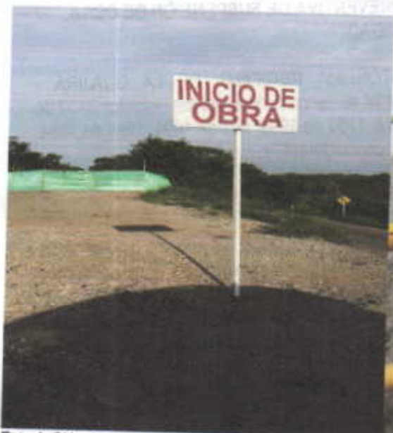
Foto 1. Sitio de la obra.

Durante la visita se puede observar la cantidad de material de concreto y hierro que cayeron al lecho de la corriente y aún persisten allí, otra gran cantidad se encuentra en el borde de la quebrada, esperando ser removida de allí (Ver Fotos).